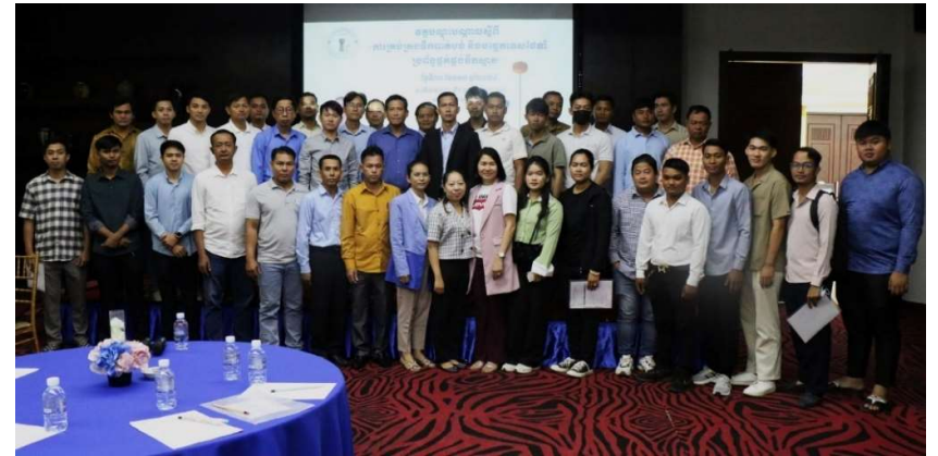
រូបភាពទី 10-រូបថតអនុស្សាវរីយ៍សម្រាប់ក្រុមទី១

២. លើកទី២៖ នៅថ្ងៃទី៣១ ខែមករា ឆ្នាំ២០២៤ វគ្គបណ្តុះបណ្តាលស្តីពី «ការគ្រប់គ្រងទឹកបាត់បង់ និងបច្ចេកទេសថែទាំប្រព័ន្ធផ្គត់ផ្គង់ទឹកស្អាត» នៅភោជនីយដ្ឋានទន្លេបាសាក់ ២ រាជធានីភ្នំពេញ មានអ្នកចូលរួមសរុបចំនួន ៤០នាក់ (ស្រី ៨នាក់)។