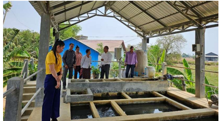
រូបភាពទី 22-ស្វែងយកពីដំណើរការផលិតទឹកនៅស្ថានីយទឹកស្អាតត្បែងខ្ពស់