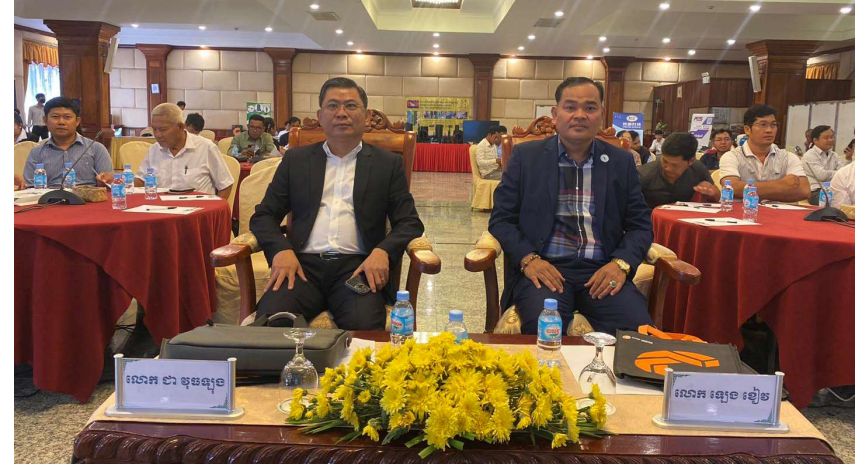
រូបភាពទី 5-កិច្ចប្រជុំថ្នាក់តំបន់នៅខេត្តសៀមរាប

Co., Ltd) ៦.ក្រុមហ៊ុន ផាមអេឡិចទ្រិកសូលូសិន ( Pump Electric Solution Co., LTD), និង ៧.ក្រុមហ៊ុន យិនតិច តិចណូឡូជី ( KINTEK Technology Co.,Ltd)។