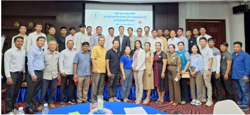
រូបភាពទី 11-រូបថតអនុស្សាវរីយ៍សម្រាប់ក្រុមទី២

៣. លើកទី៣៖ នៅថ្ងៃទី១៨ ខែមីនា ឆ្នាំ២០២៤ វគ្គបណ្តុះបណ្តាលស្តីពី «វិធីសាស្ត្រធ្វើ ដ្យាករតេស្ត និងការវិភាគគុណភាពទឹកស្អាត»។ វគ្គបណ្តុះបណ្តាលនេះរៀនទ្រឹស្តីនៅ ក្នុងសណ្ឋាគារសាន់វេ និងអនុវត្តផ្ទាល់នៅស្ថានីយផ្គត់ផ្គង់ទឹកស្អាតបែកបាន។ វគ្គ បណ្តុះបណ្តាលនេះមានអ្នកចូលរួមសរុបចំនួន ១៨នាក់ (ស្រី ១នាក់)។