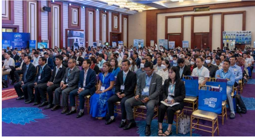
រូបភាពទី ២-សមាជិក សមាជិកាក្នុងសន្និបាតលើកទី១២

សន្និបាតទទួលបានការសហការឧបត្ថម្ភពីអង្គការ Water.org កម្មវិធី CAPRED និង ក្រុមហ៊ុន ១៩ ផ្សេងទៀតរួមមាន៖ ១.ក្រុមហ៊ុន ជី អ៊ី អឹម ខូអិលជីឌី (TEM) ២.ក្រុមហ៊ុន វ៉តធើម៉ិច ថេកណូឡូជី (Watermech) ៣.Representative Office of Fuji Electric Co., Ltd ៤.សហគ្រាសអ៊ី-ដេវ៉ែរ ស៊ីស៊ីអិល (E-Power) ៥.អិកវ៉ែរថេកណូឡូជី(X-Water) ៦.ជីស៊ីយូប្លូលីអេដើប្រាយ (TCU) ៧.ក្រុមហ៊ុនភ្នំពេញប្លាស្ទិកប្រូដាក់(Phnom Penh Plastic) ៨.ក្រុមហ៊ុនជីនីម៉ិច (Dhinimex) ៩.ក្រុមហ៊ុនវ៉ែរ ផាតនើរ (ខេមបូឌា) ៦.ក ១០.ក្រុមហ៊ុនដៃគូទឹក (Water Partners) ១១.ក្រុមហ៊ុន ខេស៊ីអាយ អ៊ិនធើណេសិន ណល ខូអេបកើរេសិន ៦.ក (KCRI) ១២.ក្រុមហ៊ុន លេសសូ (ខេមបូឌា) ត្រឌីង ៦.ក (LESSO) ១៣.Petram Design International ១៤.ក្រុមហ៊ុន ឥន្ទនូ ខេមបូឌាត្រឌីង ១៥.GEOCRAFT Co.,Ltd ១៦.Foreign Trade Bank of Cambodia ១៧. ធនាគារ សហគ្រាសធុនតូច និងមធ្យម កម្ពុជា ១៨. Stone Family Foundation និង ១៩.មីក្រូ ហិរញ្ញវត្ថុ LOLC។