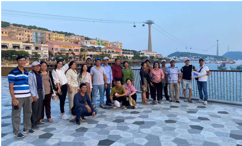
រូបភាពទី ៩-ដំណើរការសិក្សារបស់សមាជិក