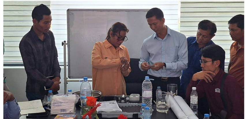
រូបភាពទី 13-សកម្មភាពអនុវត្តការតេស្តគុណភាពទឹកស្អាត

ប្រចាំត្រីមាស និងប្រចាំឆ្នាំ ៣) រៀបរាប់បានពីផលប៉ះពាល់សារធាតុគីមីដែលមាន ក្នុងទឹក ៤) អនុវត្តការធ្វើដ្យាករតេស្ត និងតេស្តគុណភាពទឹកស្អាត ៥) ទស្សនា ប្រព័ន្ធសម្អាតទឹករបស់ស្ថានីយទឹកស្អាតបែកបាន និង ៦) ការចែករំលែកបទ ពិសោធន៍ល្អពីគ្នាទៅវិញទៅមក។