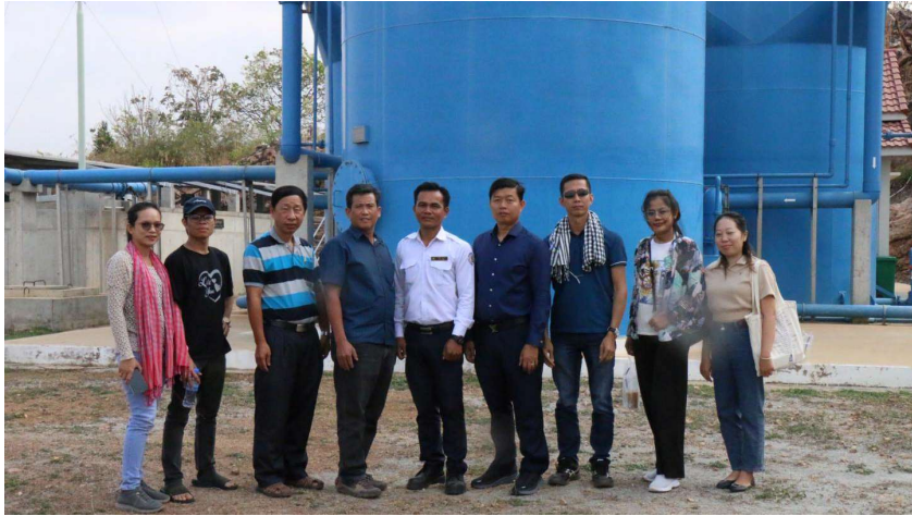
រូបភាពទី 4-ទស្សនកិច្ចសិក្សានៅរោងចក្រផលិតទឹកស្អាតម្តេច