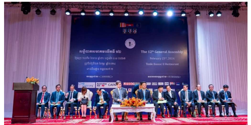
រូបភាពទី 1-កម្មវិធីបើកសន្និបាតលើកទី១២

អង្គសន្និបាតមានការអញ្ជើញជាគណៈអធិបតីដ៏ខ្ពង់ខ្ពស់ ឯកឧត្តម ហែម វណ្ណឌី រដ្ឋមន្ត្រីក្រសួងឧស្សាហកម្ម វិទ្យាសាស្ត្រ បច្ចេកវិទ្យា និងនវានុវត្តន៍ និងឯកឧត្តម ចាស់ស្ទិន វ៉ាយអេដ ឯកអគ្គរាជទូតអូស្ត្រាលី ប្រចាំប្រទេសកម្ពុជា។