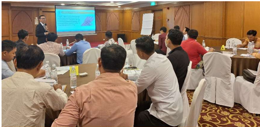
រូបភាពទី 12-សកម្មភាពពិភាក្សាក្រុម

៣. លើកទី៣៖ នៅថ្ងៃទី១៨ ខែមីនា ឆ្នាំ២០២៤ វគ្គបណ្តុះបណ្តាលស្តីពី «វិធីសាស្ត្រធ្វើ ដ្យាករតេស្ត និងការវិភាគគុណភាពទឹកស្អាត»។ វគ្គបណ្តុះបណ្តាលនេះរៀនទ្រឹស្តីនៅ ក្នុងសណ្ឋាគារសាន់វេ និងអនុវត្តផ្ទាល់នៅស្ថានីយផ្គត់ផ្គង់ទឹកស្អាតបែកបាន។ វគ្គ បណ្តុះបណ្តាលនេះមានអ្នកចូលរួមសរុបចំនួន ១៨នាក់ (ស្រី ១នាក់)។