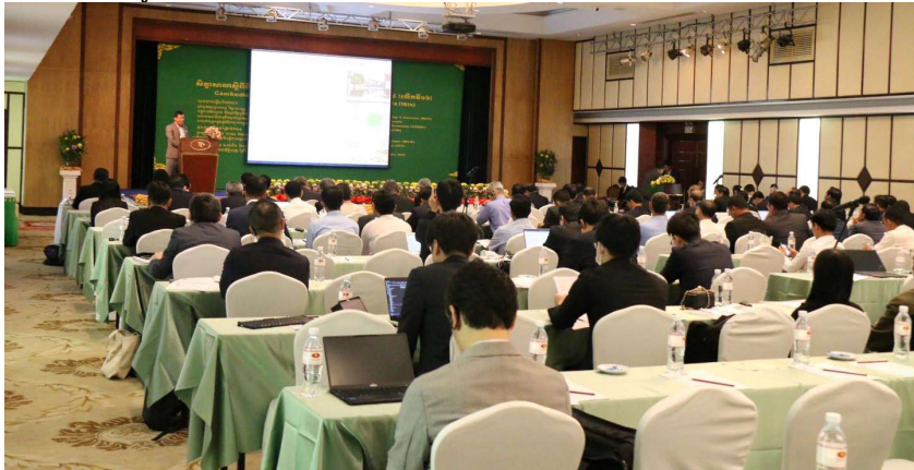
រូបភាពទី 15-សិក្ខាសាលាស្តីពីទឹកស្អាត និងប្រព័ន្ធអនាម័យ កម្ពុជា-ជប៉ុន

កាលពីថ្ងៃទី១៦-១៧ ខែមករា ឆ្នាំ២០២៤ សមាគមបានសហការសម្របសម្រួល រៀបចំសិក្ខាសាលាស្តីពីទឹកស្អាត និងប្រព័ន្ធអនាម័យ កម្ពុជា ជប៉ុន ២០២៤ (លើកទី១៦) ជាមួយសមាគមអាជីវកម្មទឹកក្រៅប្រទេស ក្រុងគីតាយូស៊ី (KOWBA) ក្រសួងឧស្សាហកម្ម វិទ្យាសាស្ត្រ បច្ចេកវិទ្យា និងនវានុវត្តន៍ (ឧវបន) អង្គការទឹកស្អាត និងប្រព័ន្ធអនាម័យ ទីក្រុងគីតាយូស៊ី ។