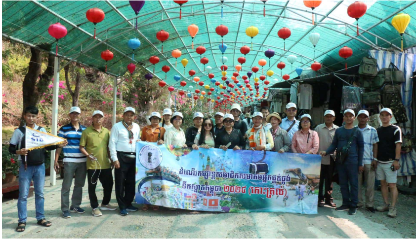
រូបភាពទី ៨-ដំណើរការសិក្សារបស់សមាជិក