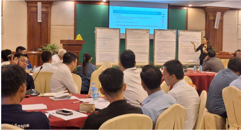
រូបភាពទី 6-បទបង្ហាញស្តីពីលទ្ធផលពិភាក្សាក្រុម