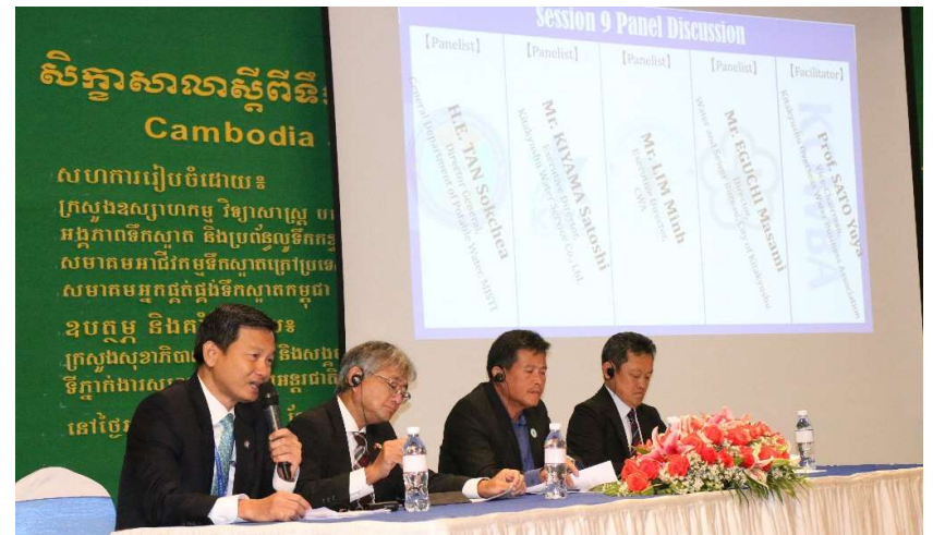
រូបភាពទី 16-កិច្ចពិភាក្សាបញ្ហាប្រឈមក្នុងការពង្រីកសេវាផ្គត់ផ្គង់ទឹកស្អាតនិងអាជីវកម្មផ្គត់ផ្គង់ទឹកស្អាត

ទន្ទឹមនេះសិក្ខាសាលាក៏បានបែងចែកសិក្ខាកាមជា ៤ក្រុមដើម្បីពិភាក្សា និងការធ្វើបទបង្ហាញទៅលើ៖ ក្រុមទី១ ទ្រព្យ ក្រុមទី២ ប្រតិបត្តិការ ក្រុមទី៣ ការគ្រប់គ្រងទិន្នន័យ និងក្រុមទី៤ អាជីវកម្ម។