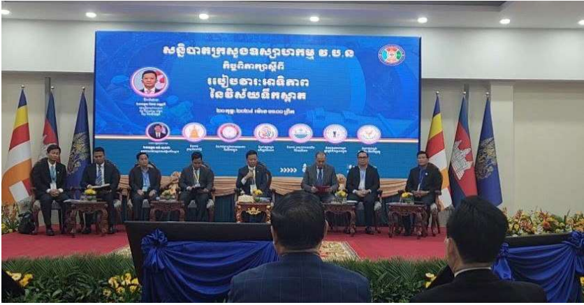
រូបភាពទី 18-កិច្ចពិភាក្សាប្រធានបទការបំពេញតួនាទីភាពជាដៃគូសហប្រតិបត្តិការដើម្បីសម្រេចគោលដៅទី ៦