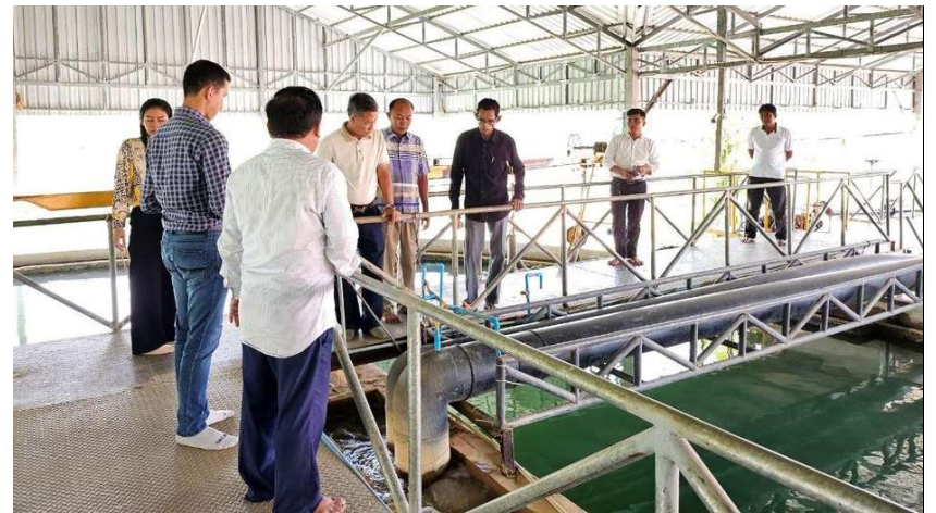
រូបភាពទី 23-ស្វែងយកពីដំណើរការផលិតទឹកនៅស្ថានីយទឹកស្អាតលង្វែក