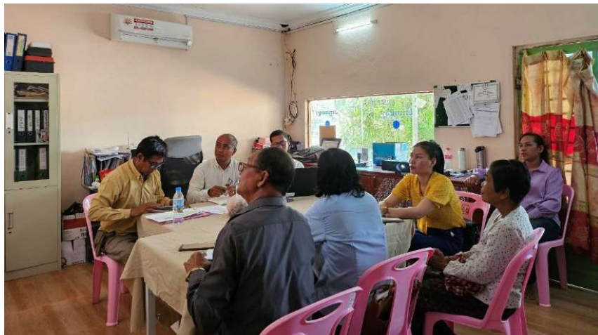
រូបភាពទី 21-សកម្មភាពបង្វឹកនៅស្ថានីយទឹកស្អាតត្បែងខ្ពស់