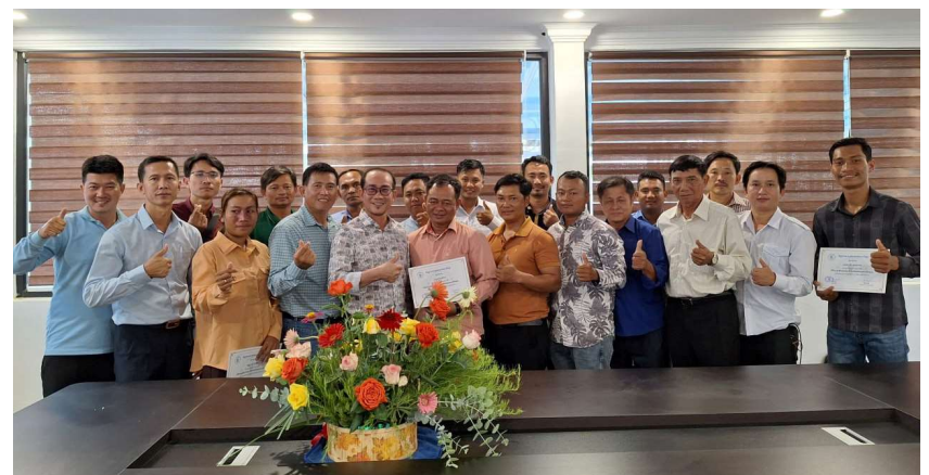
រូបភាពទី 14-រូបថតអនុស្សាវរីយ៍នៅស្ថានីយទឹកស្អាតបែកបាន