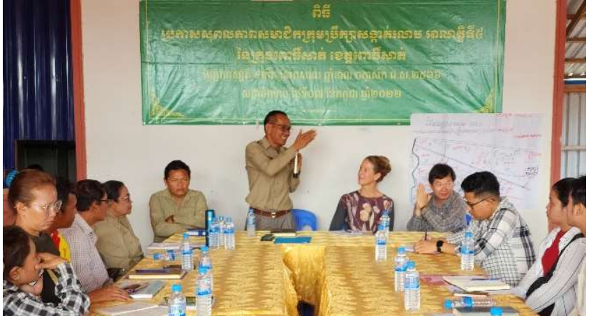
រូបភាពទី 20-កិច្ចសម្ភាសន៍ក្រុមគោលដៅ

នៅថ្ងៃទី២១ ខែកុម្ភៈ ឆ្នាំ២០២៤ បុគ្គលិកសមាគមបានចូលរួមសម្របសម្រួលជាមួយអង្គការ EMW CDRI ISF-UTS ក្នុងការសម្ភាសន៍អាជ្ញាធរមូលដ្ឋានក្នុងសង្កាត់រលាបក្រុងពោធិ៍សាត់ ខេត្តពោធិ៍សាត់។ ការសម្ភាសន៍នេះផ្តោតលើដំណើរការបង្កើតក្រុម និងការអនុវត្តន៍ផែនការសុវត្ថិភាពទឹកធន់នឹងអាកាសធាតុ។ កិច្ចសម្ភាសន៍នេះមានអ្នកចូលរួមសរុបចំនួន៤៧នាក់ ស្រី១៧នាក់។