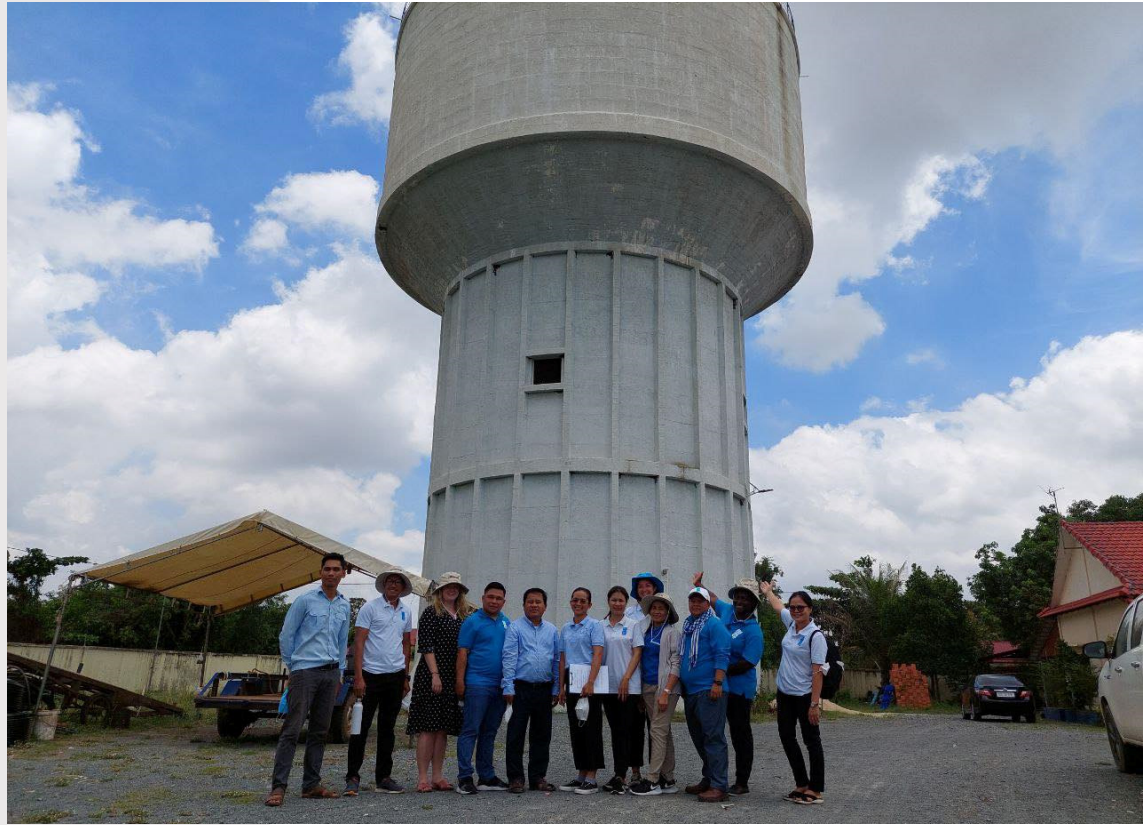
រូបភាពទី ១៥ រូបភាពទស្សនកិច្ចសិក្សារបស់ម្ចាស់ជំនួយ WaterAid

នៅថ្ងៃទី៩ ខែឧសភា ឆ្នាំ២០២២ សមាគមបានសម្របសម្រួលដំណើរទស្សនកិច្ចសិក្សាស្វែងយល់អំពីប្រព័ន្ធសម្អាតទឹក នៅក្រុមហ៊ុនលង្វែក ឌីវឡេបមិន វ៉តធើរ សីបង្ហាយ ឯ.ក តាមរយៈគម្រោងការពង្រឹងគណនេយ្យភាពរបស់សេវាករផ្គត់ផ្គង់ទឹកស្អាតដើម្បីលើកកម្ពស់សេវាកម្មទឹកស្អាតដែលទទួលបានការឧបត្ថម្ភគាំទ្រពី អង្គការ វ៉តធើរអេតកម្ពុជា។