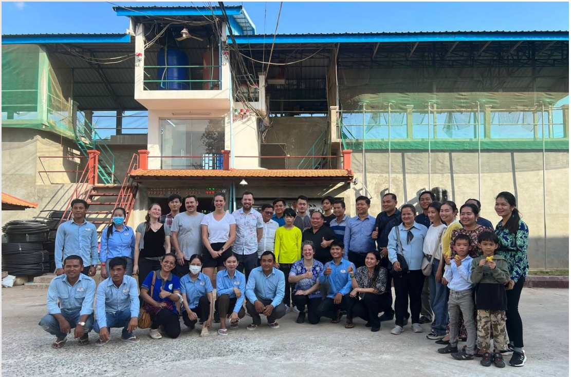
រូបភាពទី ៣២ រូបថតអនុស្សាវរីយ៍នៅស្ថានីយផ្គត់ផ្គង់ទឹកស្អាត ឡេង ខៀវ ព្រែកអំបិល