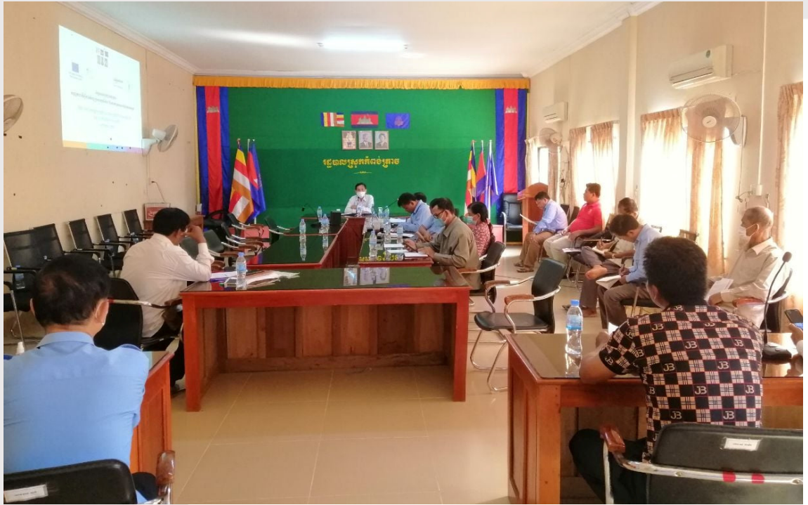
រូបភាពទី ២៣ សិក្ខាសាលាផ្សព្វផ្សាយ នៅស្រុកកំពង់ត្រាច ខេត្តកំពត