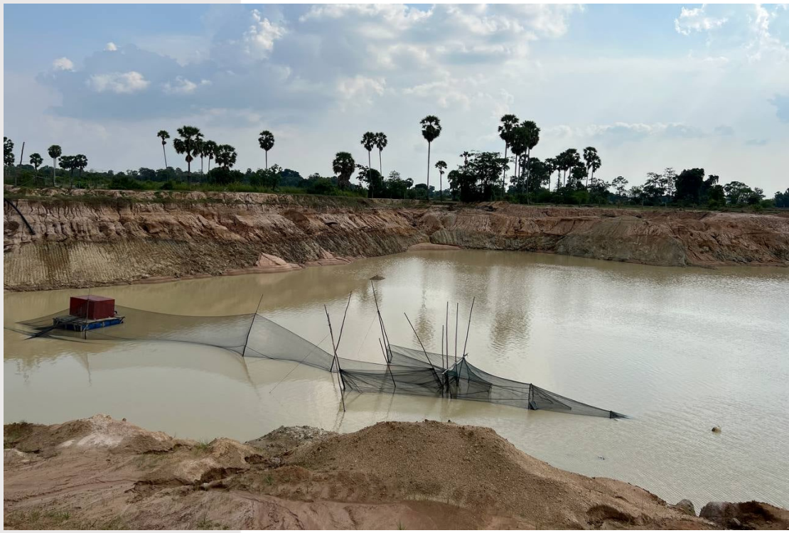
រូបភាពទី ៦ ស្រះទឹកជីកថ្មីរបស់ស្ថានីយទឹកស្អាត សេក គង់ បាត់ដំបង