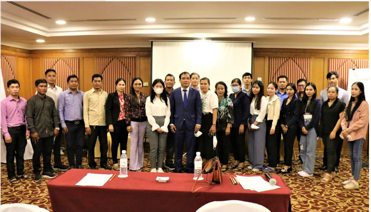
រូបភាពទី ២៥ ការថតរូបអនុស្សាវរីយ៍ក្រោយបញ្ចប់សិក្ខាសាលា