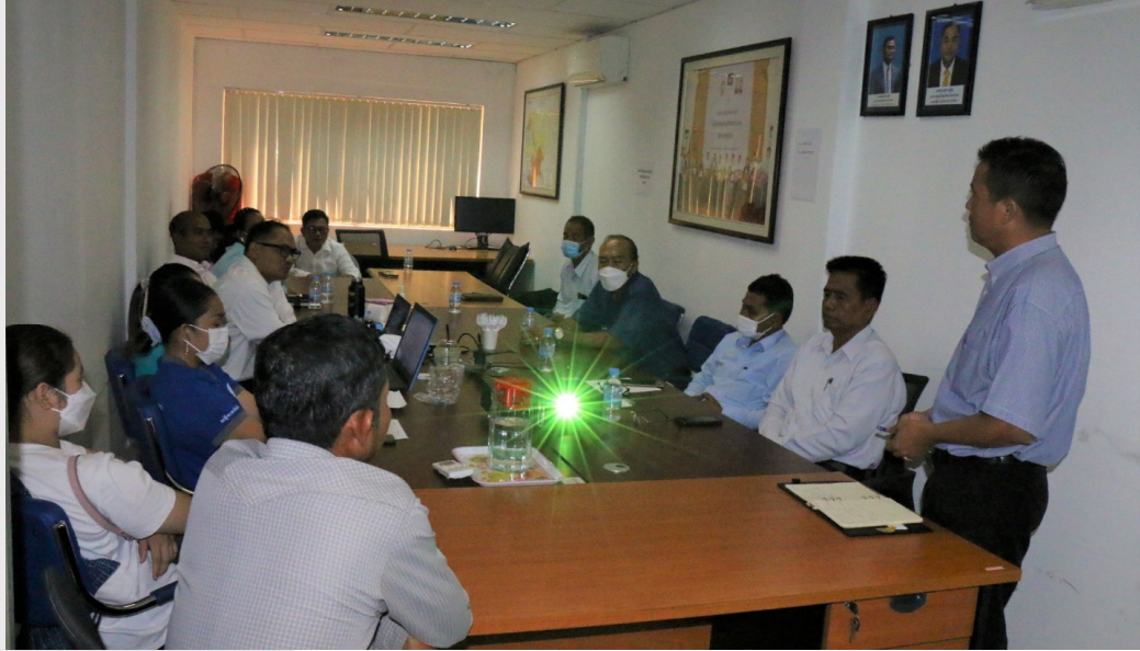
រូបភាពទី ២១ កិច្ចប្រជុំពន្លឺនៃការតភ្ជាប់បណ្តាញគ្រួសារក្រីក្រនៅការិយាល័យសមាគម

ថ្ងៃទី៧ ខែមិថុនា ឆ្នាំ២០២២ សមាគមបានរៀបចំកិច្ចប្រជុំពន្លឺនៃការតភ្ជាប់បណ្តាញគ្រួសារក្រីក្រ របស់ប្រតិបត្តិករផ្គត់ផ្គង់ទឹកស្អាត ដែលទទួលបានការគាំទ្រពីអង្គការ លោកខាងលិចជួបខាងកើត (EMW)។ កិច្ចប្រជុំមានអ្នកចូលរួមចំនួន ១៣នាក់ មកពី ៨ស្ថានីយ។