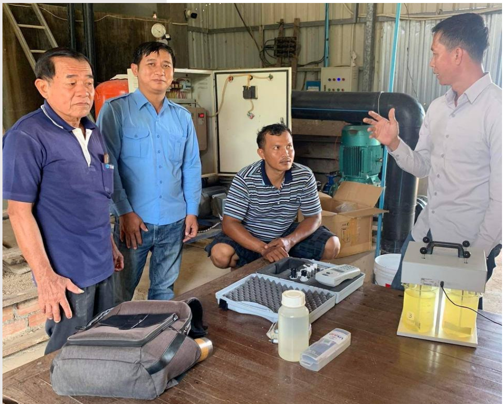
រូបភាពទី ៨ ការពង្រឹងសមត្ថភាពដល់បុគ្គលិកស្ថានីយផ្គត់ផ្គង់ទឹកស្អាត ប៉េង ហុង