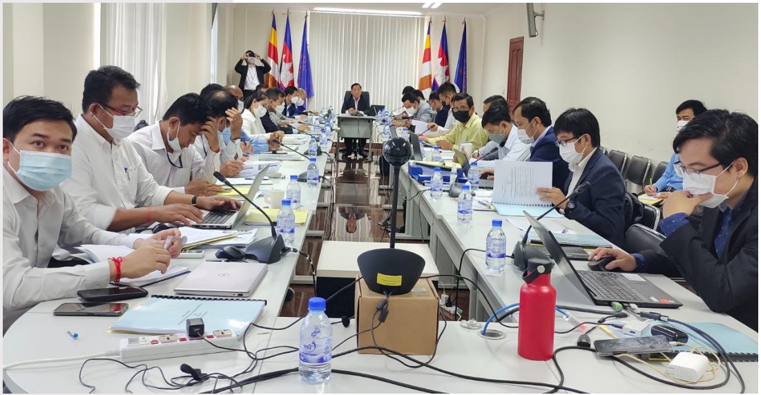
រូបភាពទី ៥ សិក្ខាសាលាពិគ្រោះយោបល់ និងប្រមូលធាតុចូលលើសេចក្តីព្រាងបឋមបទដ្ឋានគតិយុត្តចំនួន៤

ថ្ងៃទី៣០ ខែមិថុនា ឆ្នាំ២០២២ ក្រុមប្រឹក្សាភិបាល នាយកប្រតិបត្តិ និងសមាជិកសមាគម បានចូលរួម សិក្ខាសាលាពិគ្រោះយោបល់ និងប្រមូលធាតុចូលលើសេចក្តីព្រាងបឋមបទដ្ឋានគតិយុត្តចំនួន៤ ក្នុងក្របខណ្ឌ គម្រោងកសាងសមត្ថភាពគ្រប់គ្រងវិស័យទឹកស្អាតកម្ពុជា ដែលរៀបចំដោយក្រសួងឧស្សាហកម្ម វិទ្យាសាស្ត្រ បច្ចេកវិទ្យា និងនវានុវត្តន៍ និងទីភ្នាក់ងារសហប្រតិបត្តិការអន្តរជាតិនៃប្រទេសជប៉ុន (JICA) នៅទីស្តីការក្រសួង។