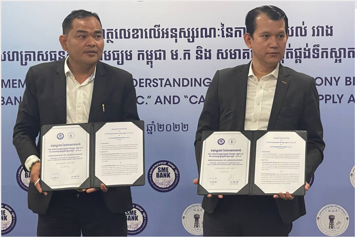
រូបភាពទី ២៨ ការចុះហត្ថលេខាលើអនុស្សាវរណៈនៃការយោគយល់គ្នារវាង SME Bank & CWA

❖ ថ្ងៃទី៩ ខែឧសភា ឆ្នាំ២០២២ ពិធីចុះហត្ថលេខាលើអនុស្សាវរណៈនៃការយោគយល់គ្នារវាង សមាគមទឹកអូស្ត្រាលី (AWA) និង សមាគមអ្នកផ្គត់ផ្គង់ទឹកស្អាតកម្ពុជា (CWA) នៅទីក្រុង Brisbane, Australia សម្រាប់រយៈពេល ២ឆ្នាំបន្ត ដើម្បីបង្កើនកិច្ចសហការរវាងសមាគមទាំងពីរ។