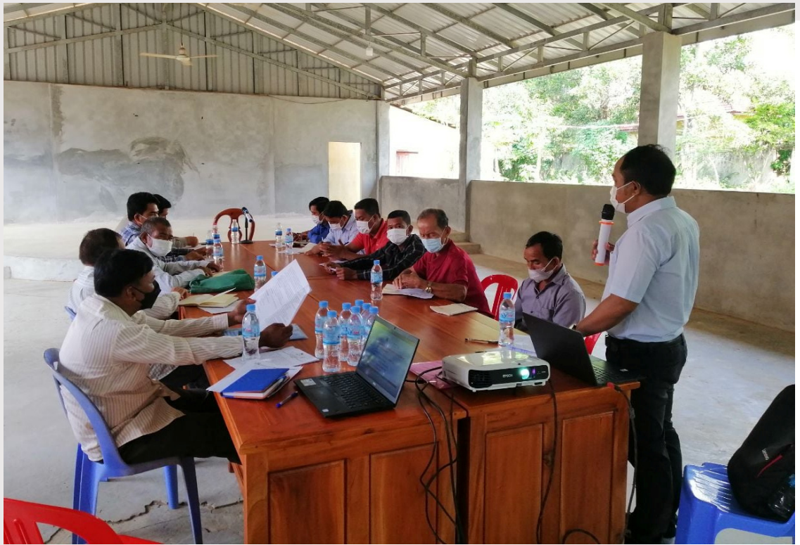
រូបភាពទី ២២ សិក្ខាសាលាផ្សព្វផ្សាយនៅស្រុកដំណាក់ចង្កើរ ខេត្តកែប

❖ ថ្ងៃទី២៧ ខែមេសា ឆ្នាំ២០២២ សិក្ខាសាលាផ្សព្វផ្សាយ «គម្រោងសម្ពន្ធភាពដើម្បីការអភិវឌ្ឍប្រកបដោយចីរភាព និងការគាំទ្រសំឡេងដើម្បីសមធម៌សង្គម» នៅស្រុកកំពង់ត្រាច ខេត្តកំពត ដែលមានអ្នកចូលរួមសរុបចំនួន ១៥នាក់ រួមមាន៖ អភិបាលរងស្រុក នាយរដ្ឋបាលស្រុក ការិយាល័យអប់រំយុវជន និងកីឡា តំណាងសហគមន៍នេសាទ ប្រធានការិយាល័យគាំទ្រឃុំសង្កាត់ ក្រុមប្រឹក្សាឃុំគោលដៅទាំងប្រាំ (១. ឃុំព្រែកក្រឹស ២. ឃុំឫស្សីស្រុកខាងកើត ៣. ឃុំឫស្សីស្រុកខាងលិច ៤. ឃុំស្វាយទទឹងខាងជើង និង៥. ៤. ឃុំស្វាយទទឹងខាងត្បូង) ប្រតិបត្តិកម្មផ្គត់ផ្គង់ទឹកស្អាតស្រុកកំពង់ត្រាច តំណាងអង្គការ Aide et Action និងបុគ្គលិកសមាគម។