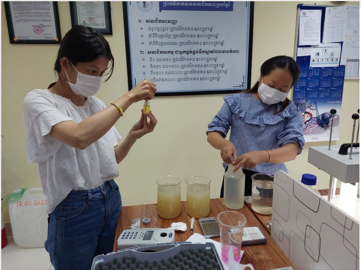
រូបភាពទី ២៧ ការធ្វើតេស្ត និងវិភាគគុណភាពទឹកទៅ របស់វិទ្យាស្ថានសមាគម (CWA)