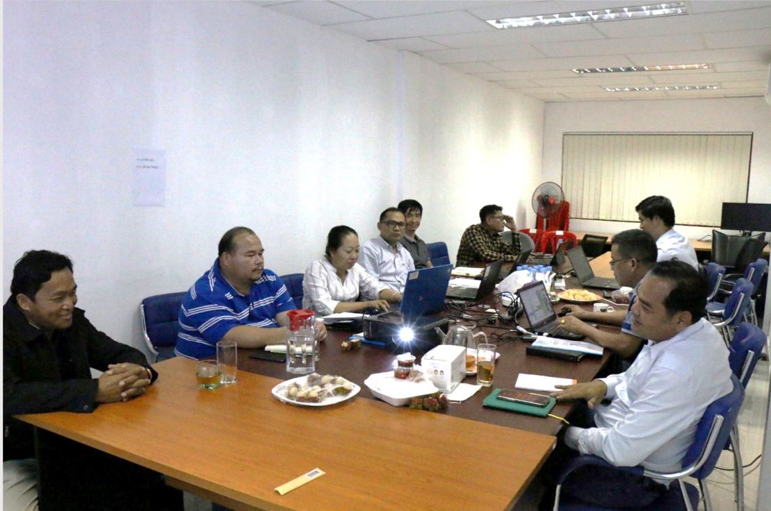
រូបភាពទី ៣ កិច្ចប្រជុំប្រចាំត្រីមាសរបស់ក្រុមប្រឹក្សាភិបាលនៅការិយាល័យសមាគម

ថ្ងៃទី២៧ ខែឧសភា ឆ្នាំ២០២២ កិច្ចប្រជុំក្រុមប្រឹក្សាភិបាលសមាគមប្រចាំត្រីមាសទី២ ឆ្នាំ២០២២ ដើម្បីធ្វើបច្ចុប្បន្នភាពការងារគម្រោងដែលសមាគមបាននឹងកំពុងអនុវត្ត និងការដេញដោលពិភាក្សាអំពីការបង់វិភាគទានរបស់សមាជិកផងដែរ។