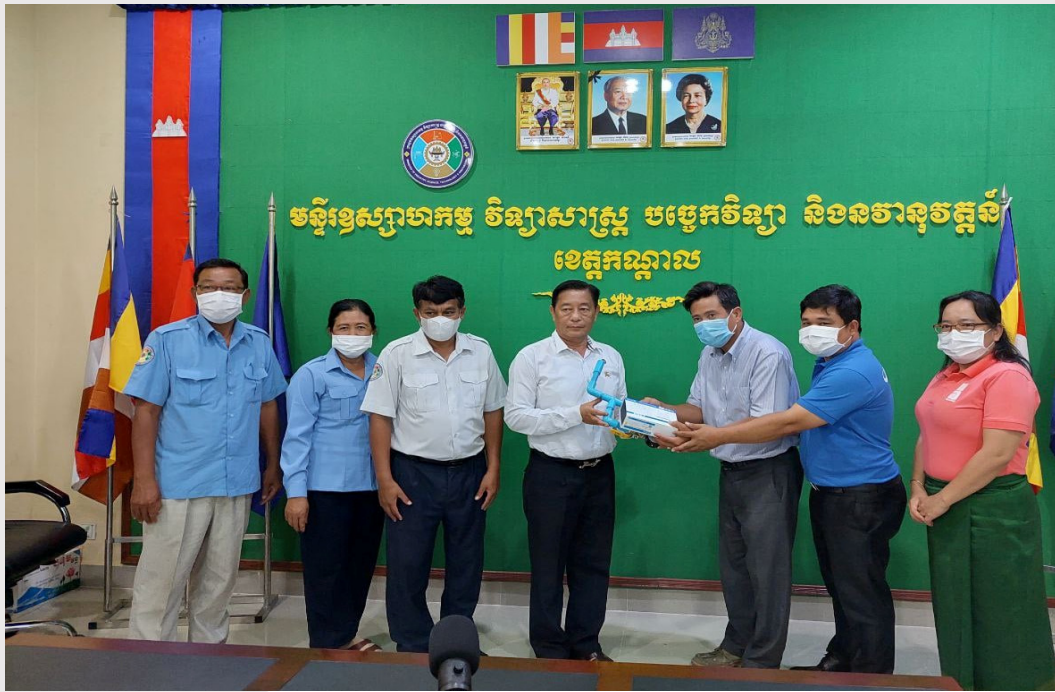
រូបភាពទី ១៣ ការប្រគល់សម្ភារៈធ្វើតេស្តសម្ពាធទឹកដល់មន្ទីរ ឧបន ខេត្តកណ្តាល