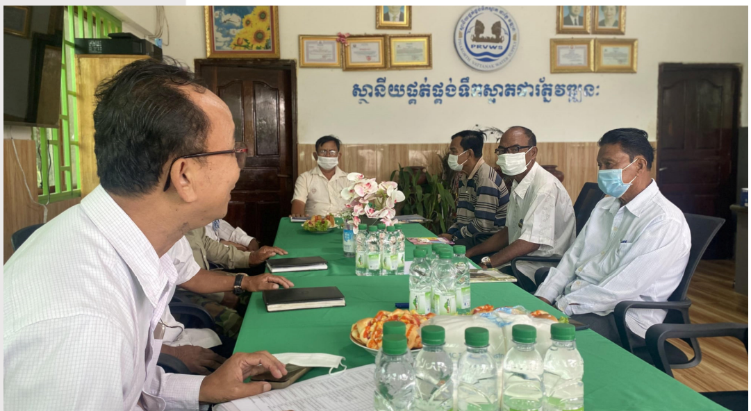
រូបភាពទី ២០ កិច្ចប្រជុំរវាង ម្ចាស់ស្ថានីយ អាជ្ញាធរភូមិ និងម្ចាស់ជំនួយ មុនចុះផ្ទៀងផ្ទាត់ទិន្នន័យ

ថ្ងៃទី៣ ខែឧសភា ឆ្នាំ២០២២ ក្រោមការឧបត្ថម្ភពីអង្គការមូលនិធិ លោកខាងលិចជួបខាងកើត (EMW) តាមរយៈគម្រោងឧបត្ថម្ភធនលើថ្លៃភ្ជាប់ទឹកសម្រាប់គ្រួសារក្រីក្រ សមាគមបានចុះផ្ទៀងផ្ទាត់ តំណគ្រួសារក្រីក្រ នៅស្ថានីយទឹកស្អាត ជាំវត្ត វឌ្ឍនៈ និងកិច្ចប្រជុំជាមួយក្រុមប្រឹក្សាឃុំស្ទឹងជ័យ មេភូមិ ដើម្បីពន្លឿការតភ្ជាប់ទឹកស្អាតជូនប្រជាពលរដ្ឋ។