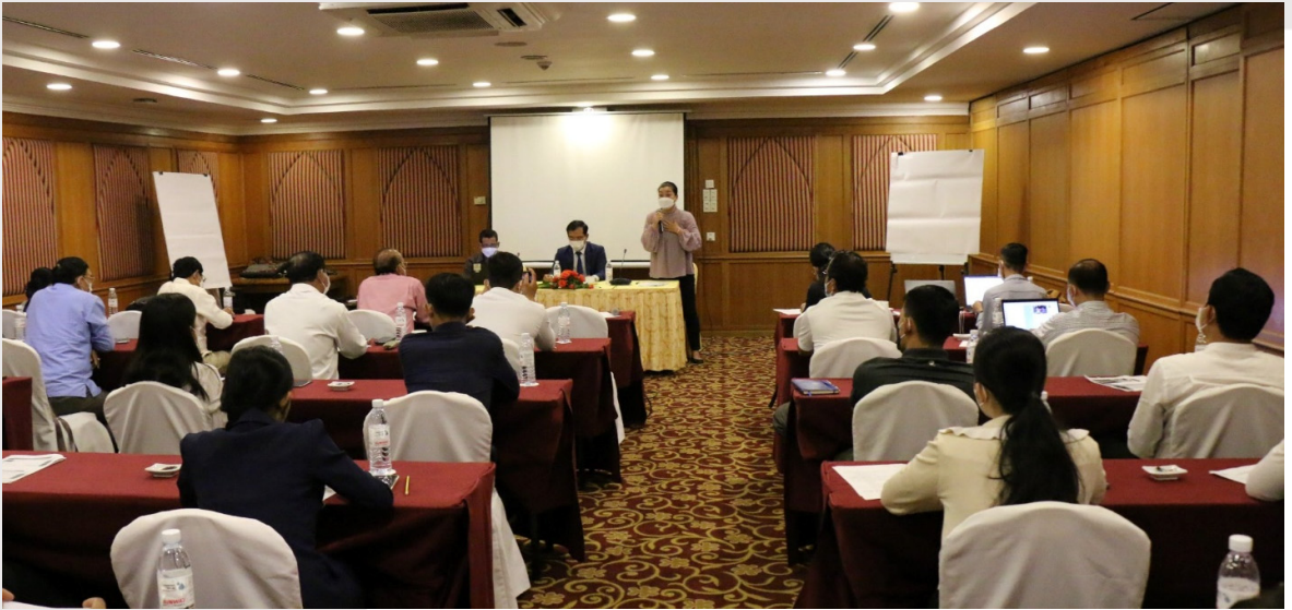
រូបភាពទី ២៤ ការធ្វើបទបង្ហាញអំពីគម្រោងជូនដល់ប្រតិបត្តិករផ្គត់ផ្គង់ទឹកស្អាត នៅសណ្ឋាគារសាន់វេ ភ្នំពេញ