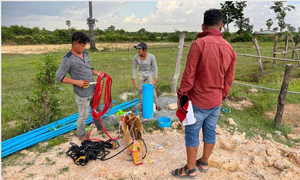
រូបភាពទី ៧ ការពង្រឹងម៉ូទ័រ ប៊ូមទឹកអណ្តូងនៅស្ថានីយ បាត់ដំរី និងស្ថានីយទឹកស្អាត ប៉េងហុង