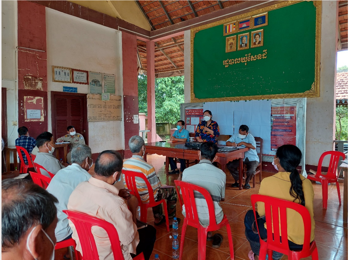
រូបភាពទី ១២ កិច្ចប្រជុំផ្សព្វផ្សាយគម្រោងជាមួយអាជ្ញាធរឃុំ

នៅក្នុងត្រីមាសនេះផងដែរ សមាគមក៏បានសហការជាមួយរដ្ឋបាលស្រុកសំរោងទង ក្នុងការរៀបចំកិច្ចប្រជុំថ្នាក់ឃុំ នៅឃុំទាំង ៦ របស់ស្រុកសំរោងទង រួមាន៖ ឃុំលាំងក្រើល ឃុំត្រពាំងគង ឃុំលាំងចក ឃុំស្ពះ ឃុំក្រាំងអំពិល និងឃុំសែនដី។ អ្នកចូលរួមសរុបចំនួន ១៩៨នាក់ (ស្រី ៣៤នាក់) ដែលមានសមាសភាពចូលរួមពី តំណាងមន្ទីរឧ.វ.ប.ន ខេត្តកំពង់ស្ពឺ មន្ត្រីរដ្ឋបាលស្រុកសំរោងទង មេឃុំសមាជិកក្រុមប្រឹក្សាឃុំ មេភូមិ ប្រតិបត្តិករផ្គត់ផ្គង់ទឹកស្អាត តំណាងមណ្ឌលសុខភាព តំណាងសាលារៀន និងតំណាងប៉ុស្តិ៍ប៉ូលីស។