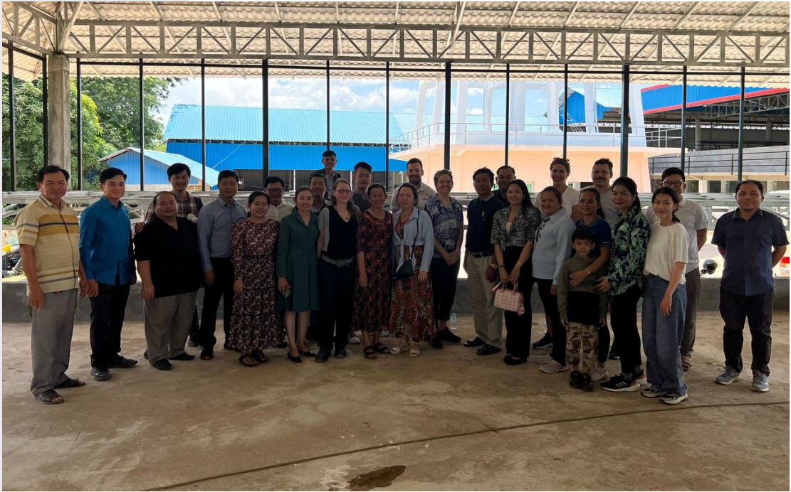
រូបភាពទី ៣១ រូបថតអនុស្សាវរីយ៍នៅស្ថានីយផ្គត់ផ្គង់ទឹកស្អាត កំពង់ចំលង