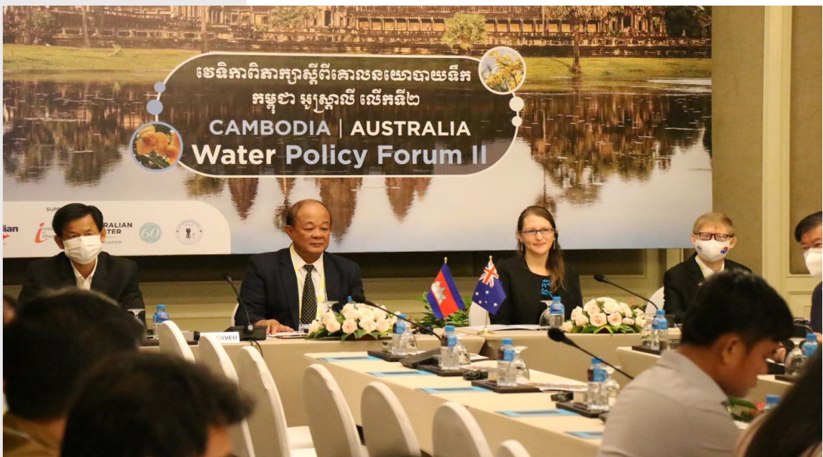
រូបភាពទី ៣០ វេទិកាពិភាក្សាស្តីពី គោលនយោបាយទឹក កម្ពុជា អូស្ត្រាលី លើកទី២