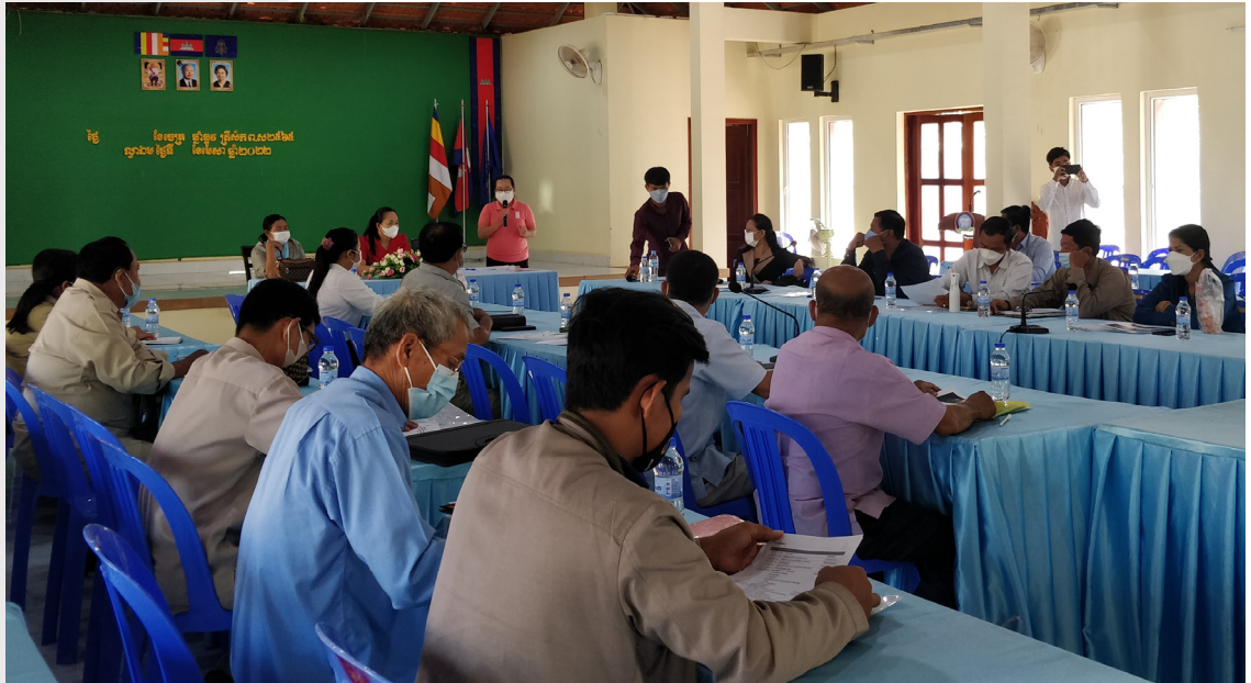
រូបភាពទី ១៦ រូបភាពសិក្ខាសាលាផ្សព្វផ្សាយគម្រោងនៅក្នុងសាលប្រជុំសាលាស្រុកល្វាឯម