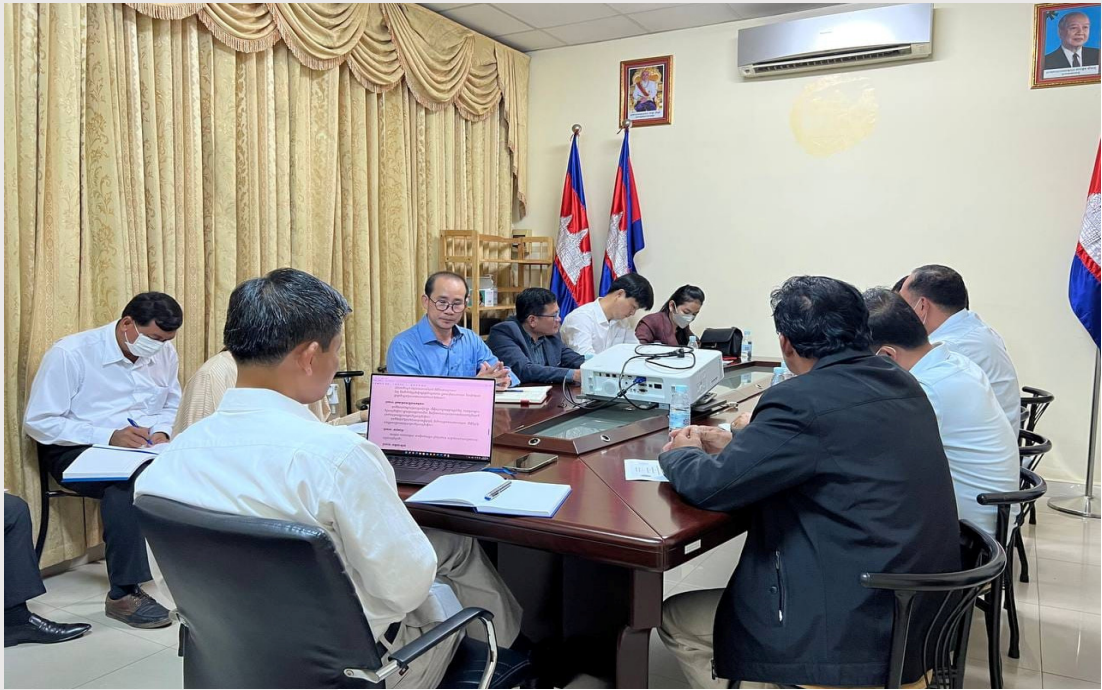
រូបភាពទី ៤ ការជួបប្រជុំជាមួយ អគ្គនាយកនៃអគ្គនាយកដ្ឋានទឹកស្អាត