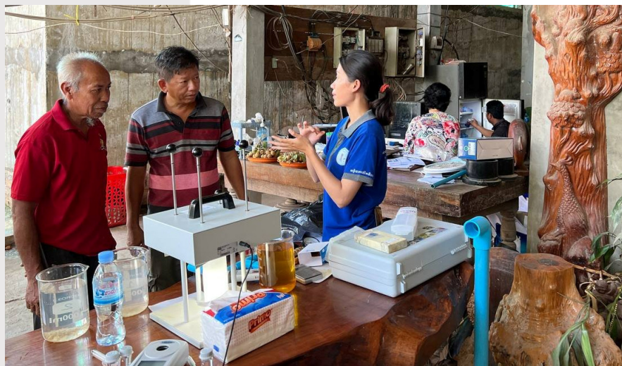
រូបភាពទី ១៧ ការធ្វើដ្យាក្រេស្ត (Jar Test) របស់បុគ្គលិកសមាគម នៅទឹកស្អាត ស្វាយប្រទាល ស្រុកស្អាង

សមាគមបានរៀបចំវគ្គបង្វឹកស្តីពី «ការតេស្តគុណភាពទឹកស្អាត» និង«សេវាកម្មអតិថិជន» ទៅដល់បុគ្គលិករបស់ស្ថានីយផ្គត់ផ្គង់ទឹកស្អាត ដោយមានការជួបជុំផ្ទាល់នៅស្ថានីយផ្គត់ផ្គង់ទឹកស្អាតចំនួន ៤ទីតាំង ១.ស្ថានីយផ្គត់ផ្គង់ទឹកស្អាតកោះខ្សាច់ទន្លា ២.ស្ថានីយទឹកស្អាត ឡេង ខៀវព្រែកអំបិល ៣.ស្ថានីយផ្គត់ផ្គង់ទឹកស្អាតស្វាយប្រទាល និង៤.ស្ថានីយផ្គត់ផ្គង់ទឹកស្អាតទីប្រជុំជនត្រើយស្នា នៅក្នុងស្រុកស្អាង និងចំនួន ១ទីតាំង នៅស្ថានីយផ្គត់ផ្គង់ទឹកស្អាត ព្រែកឫស្សី ក្នុងស្រុកល្វាឯម។