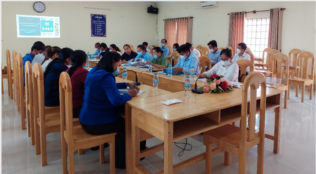
រូបភាពទី ១០ រូបភាពវគ្គបណ្តុះបណ្តាលនៅស្រុកអង្គស្នួល