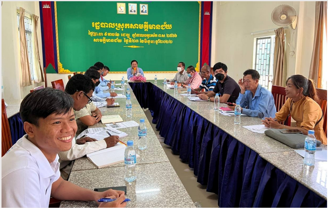
រូបភាពទី ១៩ រូបភាពប្រជុំបើកវគ្គបណ្តុះបណ្តាល នៅសាលាស្រុកសាមគ្គីមានជ័យ