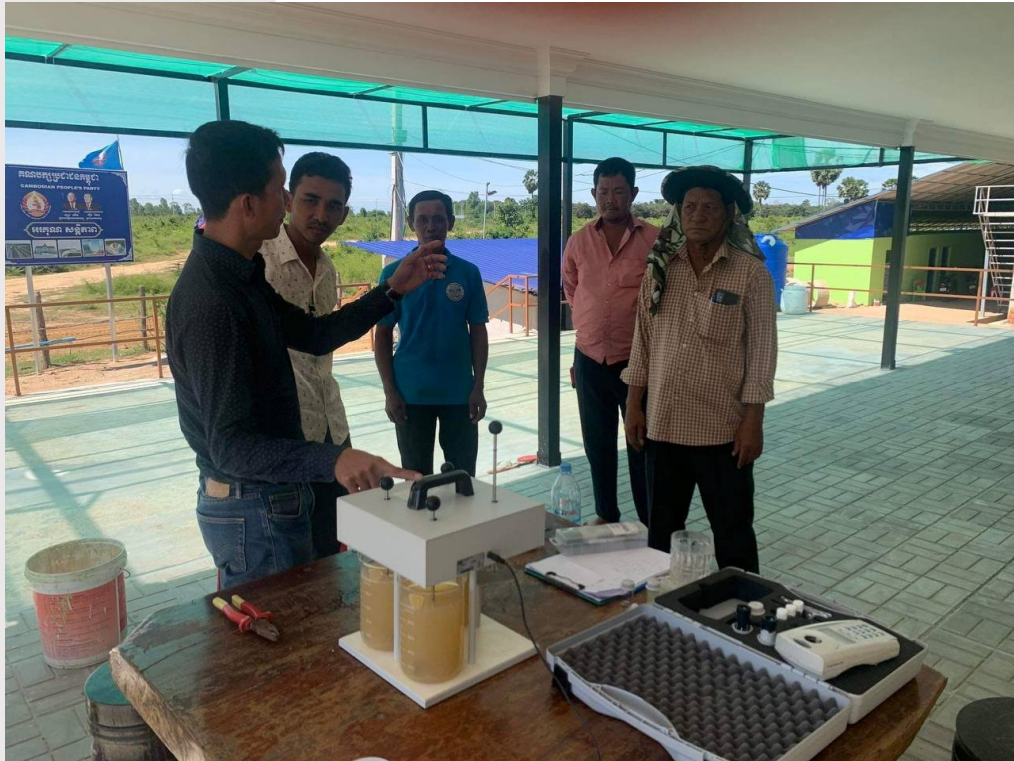
រូបភាពទី ៩ ការបង្ហាញស្តីពីបច្ចេកទេសក្នុងការផលិត និងផ្គត់ផ្គង់ទឹកស្អាត ដល់បុគ្គលិករបស់ស្ថានីយទឹកស្អាត