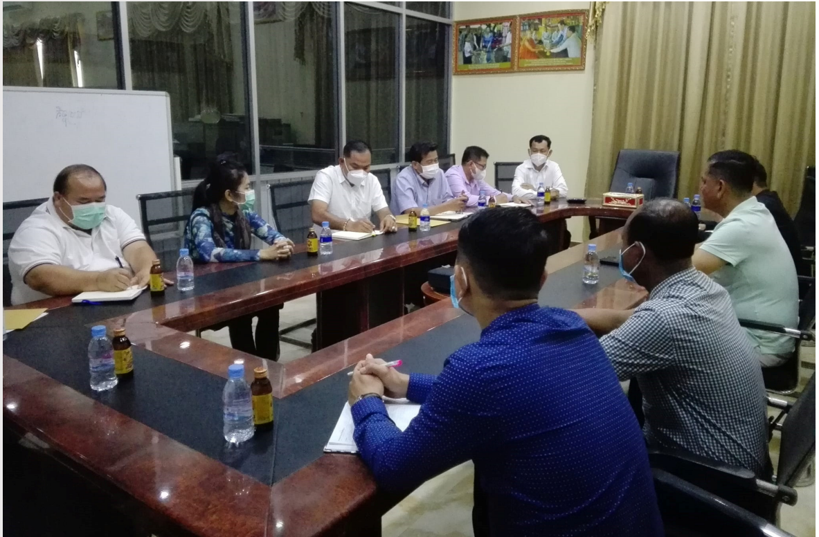
រូបភាពទី ២៦ កិច្ចដោះស្រាយវិវាទរវាង ស្ថានីយទឹកស្អាត ចាន់ ណារី និងក្រុមហ៊ុនកាស៊ីណូក្រោន

ឃុំសំពៅពូន ស្រុកកោះធំ ខេត្តកណ្តាល ដើម្បីដោះស្រាយបញ្ហា «ការផ្គត់ផ្គង់ទឹកស្អាតរបស់ក្រុមហ៊ុនកាស៊ីណូ ក្រោន នៅក្នុងតំបន់អាជ្ញាប័ណ្ណទឹកស្អាត ចាន់ ណារី» ដែលជាសមាជិករបស់សមាគម។ ភាគីទាំងពីរបានឯកភាព យកសំណើរបស់ភាគីទាំងសងខាងទៅសុំយោបល់ម្ចាស់ក្រុមហ៊ុនរៀងៗខ្លួន។ កិច្ចប្រជុំបញ្ចប់ដោយភាពយោគ យល់និងស្និទ្ធស្នាល។