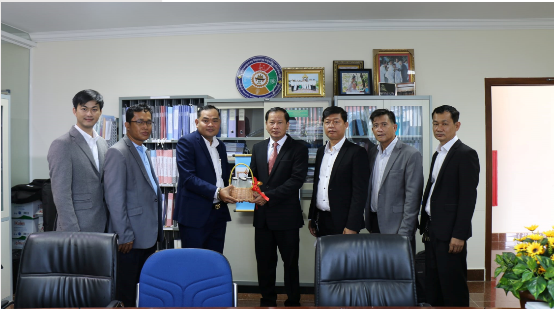
រូបភាពទី ១ និងទី២ ការចូលរួមសំដែងការគូរសម និងថតរូបអនុស្សាវរីយ៍