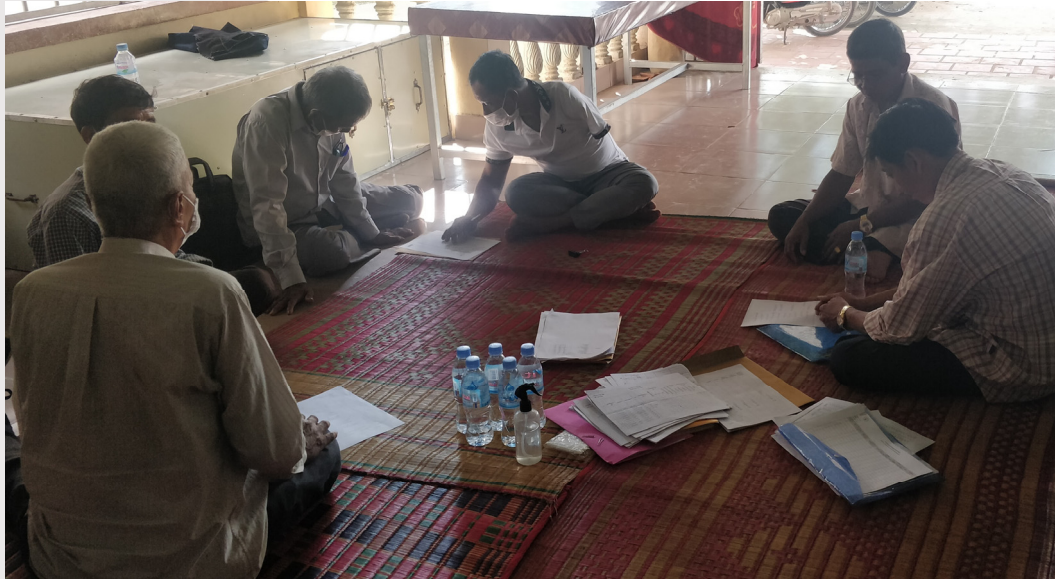
រូបភាពទី ១៨ រូបភាពបុគ្គលិកសមាគមចុះប្រមូលទិន្នន័យគ្រួសារក្រីក្រ

សមាគមបានសហការជាមួយសមាគមជនពិការស្រុកស្អាង ដើម្បីប្រមូលទិន្នន័យដើមគ្រាអំពី គ្រួសារក្រីក្រដែលបានភ្ជាប់ទឹកស្អាតរួច និងមិនទាន់បានភ្ជាប់ នៅក្នុងឃុំចំនួន ៥ គឺ ១). ឃុំស្វាយ ប្រទាល ២). ឃុំព្រែកអំបិល ៣). ឃុំកោះខែល ៤). ឃុំកោះខ្សាច់ទន្លា និង ៥). ឃុំត្រើយស្នា ស្រុកស្អាង ខេត្តកណ្តាល ដែលជាតំបន់សេវាកម្មរបស់ស្ថានីយផ្គត់ផ្គង់ទឹកស្អាត (១). ស្ថានីយផ្គត់ផ្គង់ទឹកស្អាត កោះខ្សាច់ទន្លា ២). ស្ថានីយទឹកស្អាត ឡេង ខៀវ ព្រែកអំបិល ៣). ស្ថានីយផ្គត់ផ្គង់ទឹកស្អាតស្វាយ ប្រទាល និង ៤). ស្ថានីយផ្គត់ផ្គង់ទឹកស្អាតទីប្រជុំជនត្រើយស្នា)។