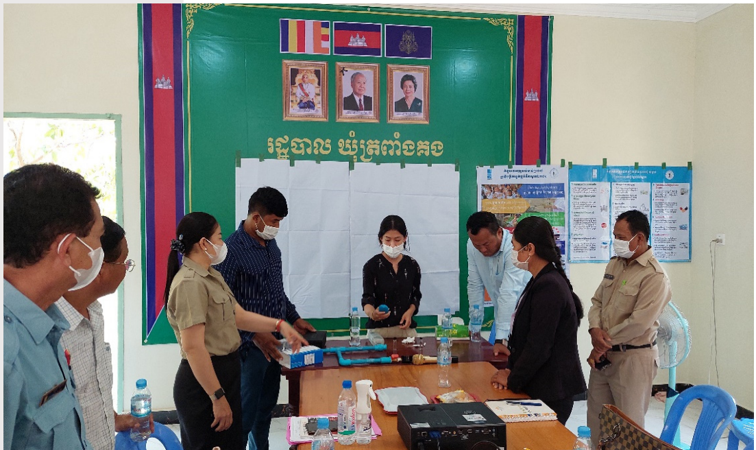
រូបភាពទី ១១ រូបភាពបង្កើតអាជ្ញាធរនៅឃុំត្រពាំងគង

នៅក្នុងត្រីមាសនេះផងដែរ សមាគមក៏បានសហការជាមួយរដ្ឋបាលស្រុកសំរោងទង ក្នុងការរៀបចំវគ្គបង្កើតស្តីពី «ការតេស្តគុណភាពទឹកស្អាត» នៅឃុំទាំង ៦ របស់ស្រុកសំរោងទង ក្រោមការឧបត្ថម្ភពីអង្គការវ៉តធីអេតកម្ពុជា។ អ្នកចូលរួមសរុបចំនួន ៥៣នាក់ (ស្រី ១៧នាក់) ដែលមានសមាសភាពចូលរួមពីតំណាងមន្ទីរឧ.វ.ប.ន ខេត្តកំពង់ស្ពឺ មន្ត្រីរដ្ឋបាលស្រុកសំរោងទង មេឃុំ សមាជិកក្រុមប្រឹក្សាឃុំ និងប្រតិបត្តិករផ្គត់ផ្គង់ទឹកស្អាត។