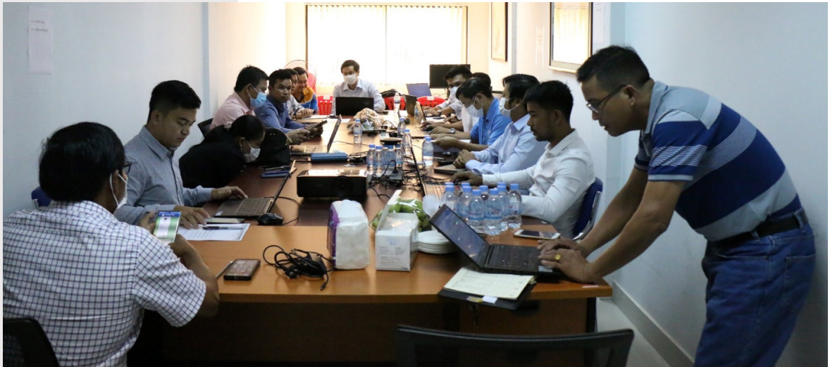
រូបភាពទី ២៩ ការចូលរួមវគ្គសិក្ខាសាលានៅការិយាល័យសមាគម