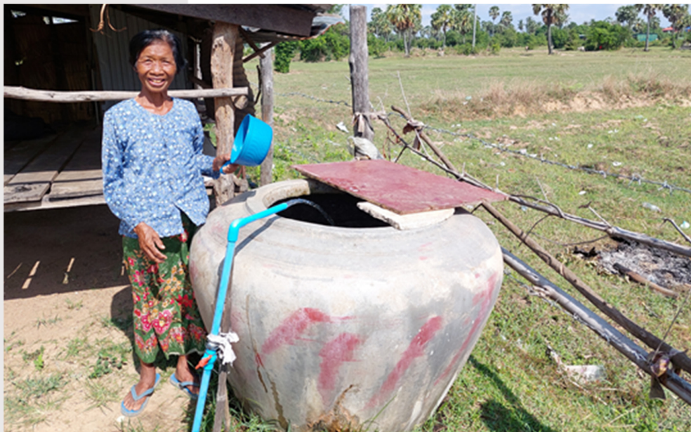
រូបភាពទី ១៤ រូបភាពគ្រួសារក្រីក្រនៅឃុំស្វាយ ស្រុកសាមគ្គីមានជ័យ ខេត្តកំពង់ឆ្នាំង

ត្រីមាសទី២នេះ សមាគមបានសម្របសម្រួលភ្ជាប់សេវាទឹកស្អាតជូនគ្រួសារក្រីក្របានចំនួន ១១៧ គ្រួសារ ដែលទទួលបានការឧបត្ថម្ភធនពី ១).ក្រុមហ៊ុនលង្វែក ឌីវឡូបមិន វ៉តធើរ សីបផ្លាយ ឯ.ក និង ២).ស្ថានីយផ្គត់ផ្គង់ទឹកស្អាត កុល និងគម្រោងដែលគាំទ្រថវិកាដោយអង្គការវ៉តធើរអេតកម្ពុជា។ ជាលទ្ធផល ៧៤គ្រួសារបានផ្ទៀងផ្ទាត់រួច ៤៣គ្រួសារមិនទាន់បានផ្ទៀងផ្ទាត់(ក្រុមការងារនឹងផ្ទៀងផ្ទាត់នៅត្រីមាស ក្រោយ)។