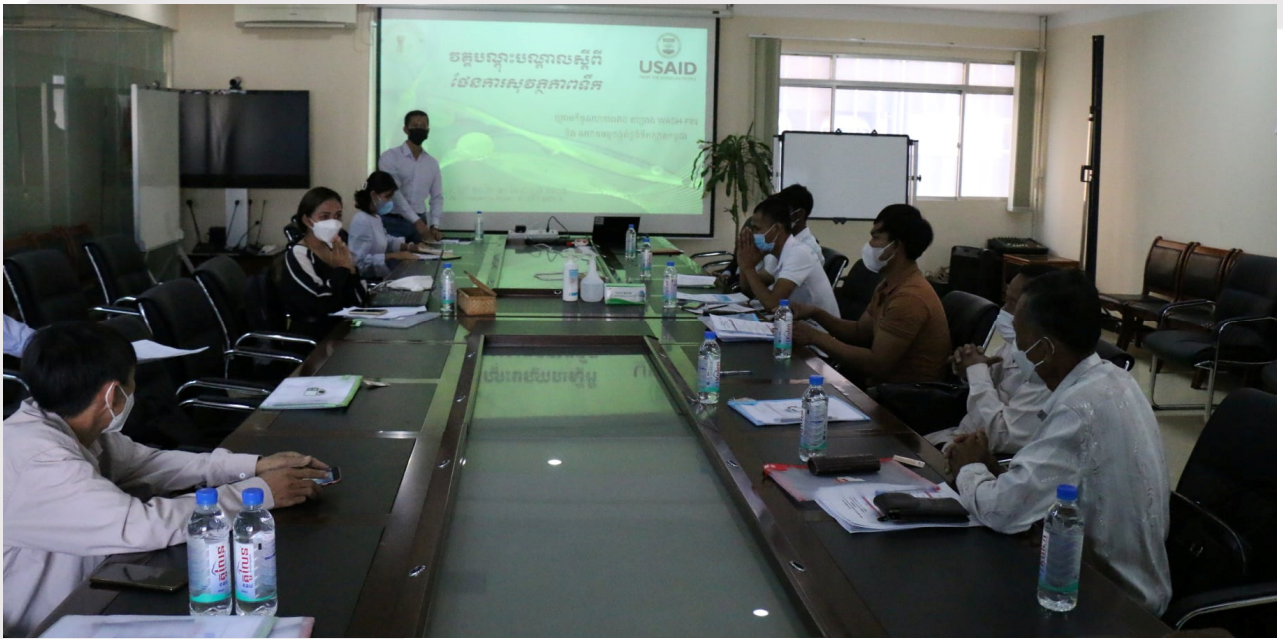
រូបភាពទី៤៖ រូបភាពវគ្គបណ្តុះបណ្តាលស្តីពី «ផែនការសុវត្ថិភាពទឹក»