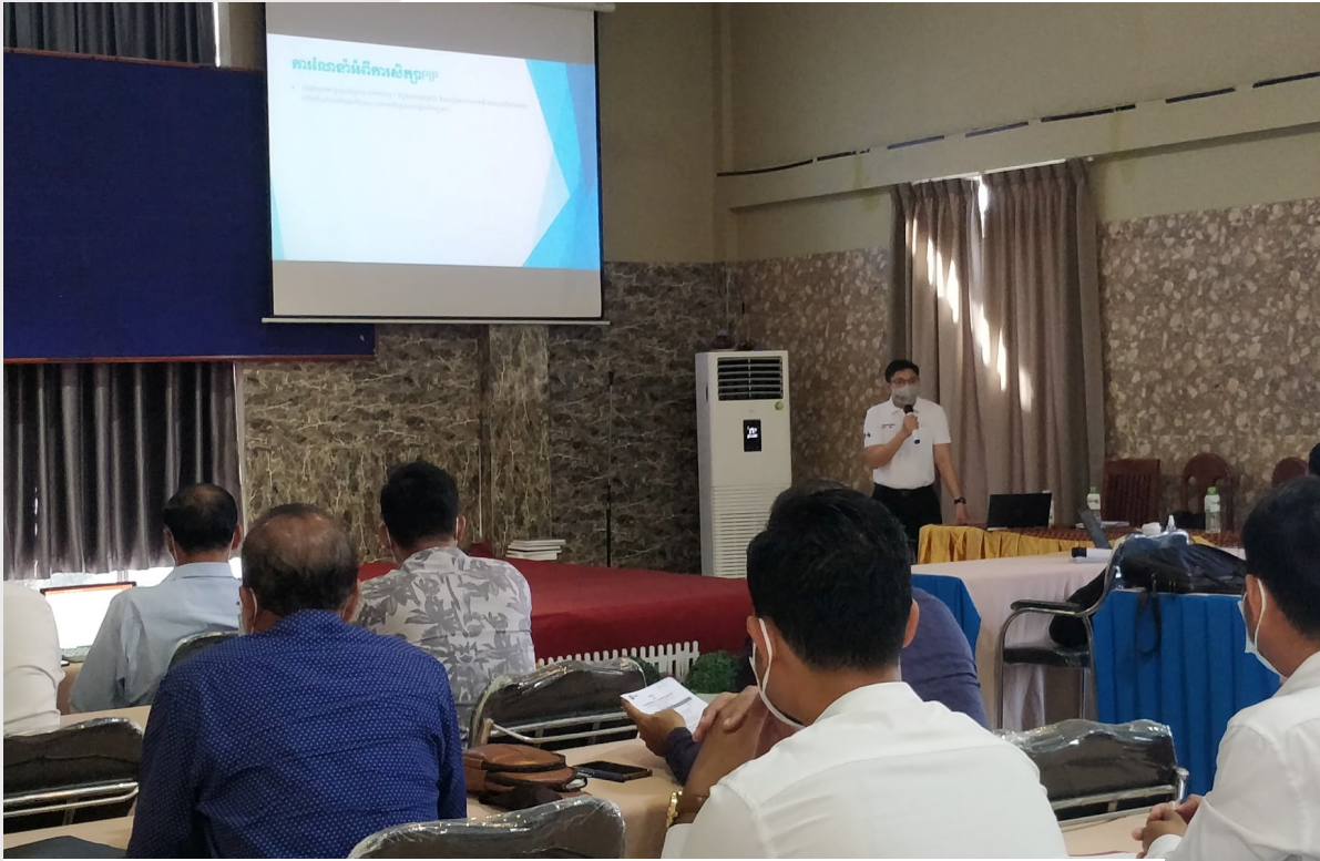
រូបភាពទី១៦៖ ការថតរូបអនុស្សាវរីយ៍ ក្រោយបញ្ចប់វគ្គបណ្តុះបណ្តាល នៅសណ្ឋាគារឆ្នេរថ្មី