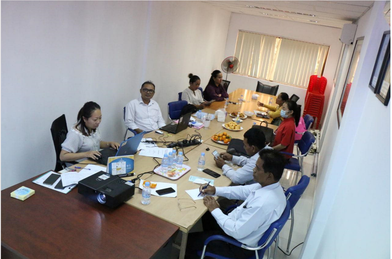
រូបភាពទី១៤៖ ការធ្វើបទបង្ហាញអំពីគម្រោងបដិភាគគ្រួសារក្រីក្រ ដល់ប្រតិបត្តិករទឹកស្អាត នៅការិយាល័យសមាគម

ថ្ងៃទី២៨ ខែមករា ឆ្នាំ២០២២ សមាគមបានរៀបចំកិច្ចប្រជុំដើម្បីណែនាំគម្រោងបដិភាគគ្រួសារក្រីក្រទៅដល់ប្រតិបត្តិករផ្គត់ផ្គង់ទឹកស្អាត ចំនួន ៥ស្ថានីយ (សរុបមាន ៨នាក់) ដែលបានជ្រើសរើសបន្ថែម។