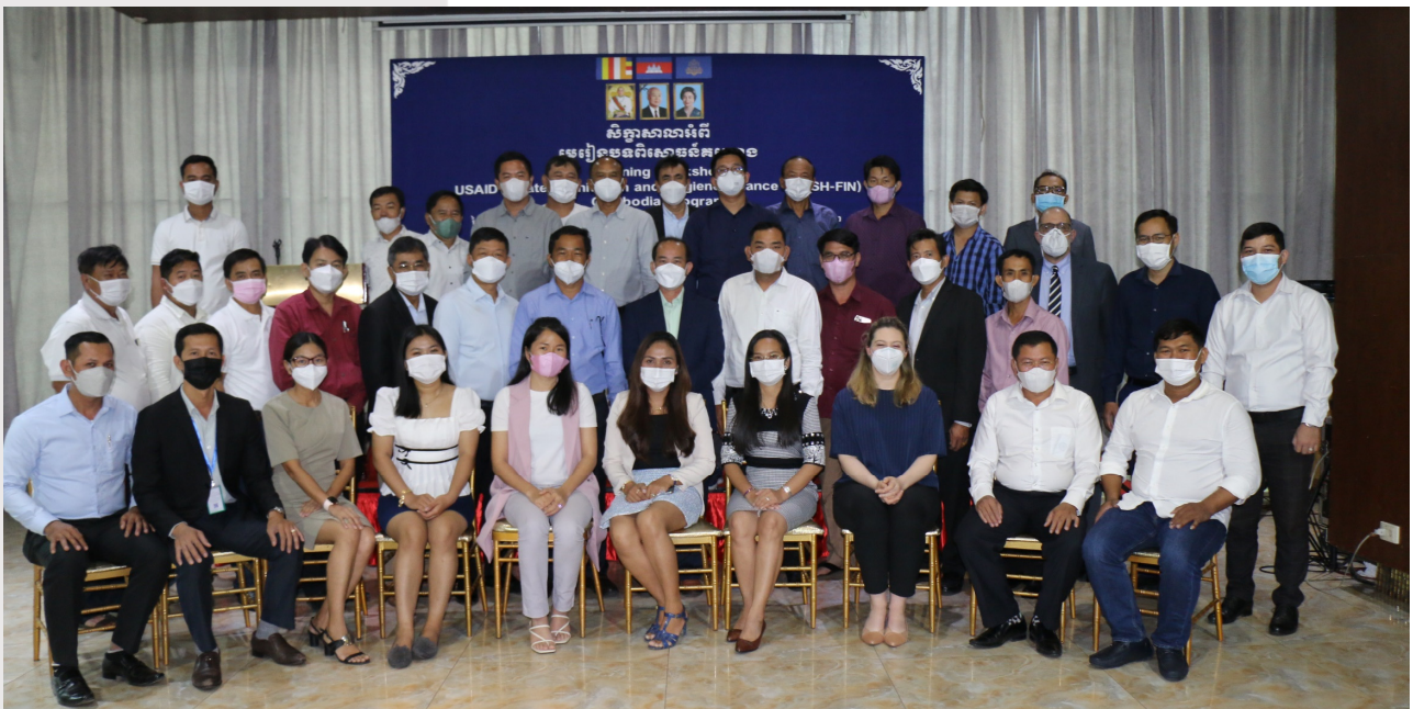
រូបភាពទី៥៖ រូបភាពសិក្ខាសាលាបិទបញ្ចប់ និងការឆ្លុះបញ្ចាំងគម្រោង WASH-FIN

ថ្ងៃទី១០-១១ ខែមីនា ឆ្នាំ២០២២ ក្រោមជំនួយឧបត្ថម្ភពី ទីភ្នាក់ងារសហរដ្ឋអាមេរិកសម្រាប់ការអភិវឌ្ឍន៍អន្តរជាតិ USAID តាមរយៈគម្រោង (WASH-FIN) សមាគមបានរៀបចំសិក្ខាសាលារៀនសូត្រជាមួយភាគីពាក់ព័ន្ធ និងការឆ្លុះបញ្ចាំងចុងក្រោយ ក្នុងគោលបំណងឆ្លុះបញ្ចាំងពីសមិទ្ធផលនានារបស់គម្រោង WASH-FIN នៅកម្ពុជា។