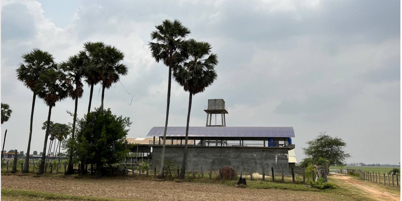
រូបភាពទី៧៖ ស្ថានីយ៍ផ្គត់ផ្គង់ទឹកស្អាត ក្រាំងចេក

ថ្ងៃ១៦ ខែមីនា ឆ្នាំ២០២២ បានចុះពិនិត្យ និងផ្ទៀងផ្ទាត់បណ្តាញចែកចាយទឹកស្អាត នៅស្ថានីយ៍ផ្គត់ផ្គង់ទឹកស្អាត ក្រាំងចេក ដែលមានទីតាំងនៅឃុំក្រាំងចេក ស្រុកឧដុង្គ ខេត្តកំពង់ស្ពឺ។