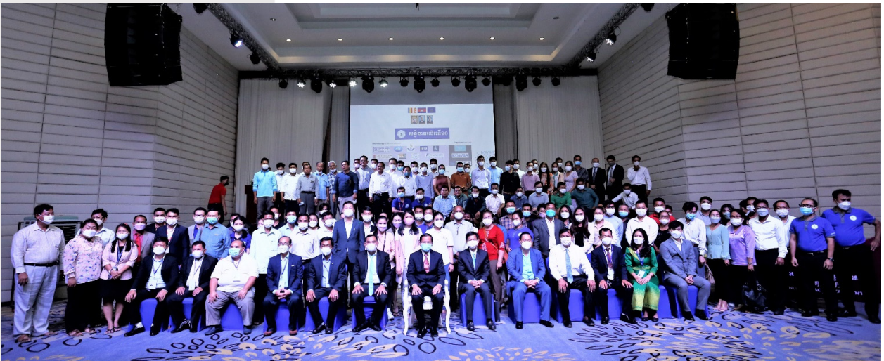
រូបភាពទី២៖ រូបភាពអនុស្សាវរីយ៍នៅថ្ងៃសន្និបាតសមាគម