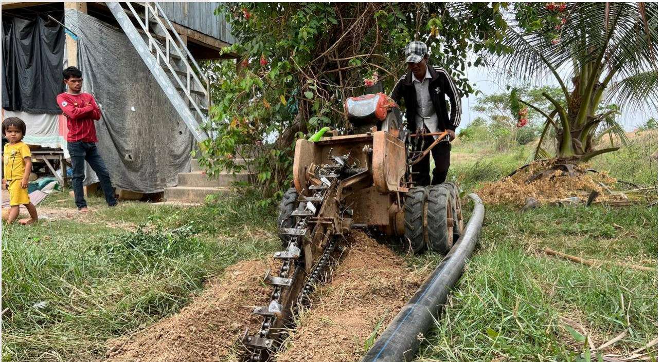
រូបភាពទី៨៖ សកម្មភាពដឹកដឹកបំពង់ទឹកស្អាត របស់ស្ថានីយ៍ទឹកស្អាតវិនិគារ

ថ្ងៃទី១៨ ខែមីនា ឆ្នាំ២០២២ បានចុះពិនិត្យ និងផ្ទៀងផ្ទាត់បណ្តាញចែកចាយទឹកស្អាត នៅស្ថានីយ៍ទឹកស្អាតវិនិគារ ដែលមានទីតាំងនៅ ឃុំបុរីជលសារ ស្រុកបុរីជលសារខេត្តតាកែវ។