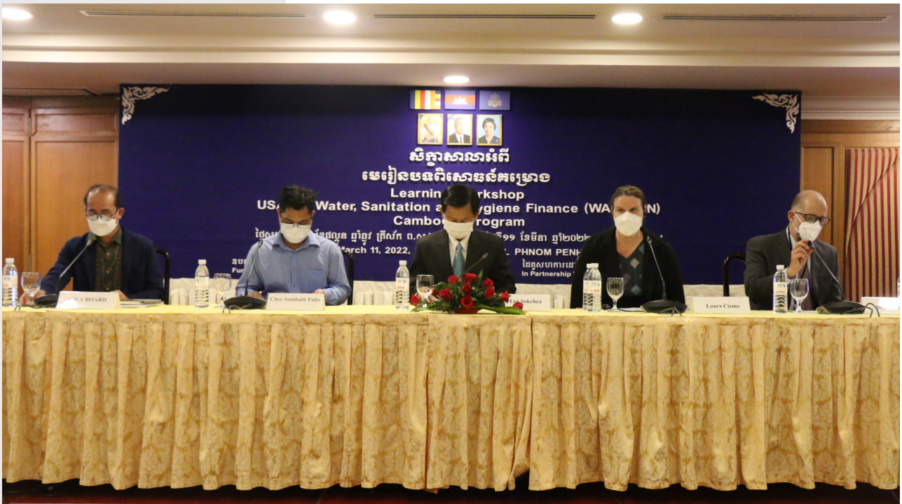
រូបភាពទី៦៖ រូបភាពសិក្ខាសាលាបិទបញ្ចប់ និងការឆ្លុះបញ្ចាំងគម្រោង WASH-FIN

ថ្ងៃទី១១ ខែមីនា ឆ្នាំ២០២២ នៅសណ្ឋាគារសាន់រ៉េ សមាគមបានរៀបចំសិក្ខាសាលាឆ្លុះបញ្ចាំងគម្រោងWASH-FIN ដែលអ្នកចូលរួមសរុបចំនួន ៥៣នាក់ (ស្រី ១៥នាក់) ដែលមានសមាសភាពចូលរួមពីតំណាងក្រសួងឧបសគ្គ ចំនួន ៣នាក់ តំណាងក្រសួងមហាផ្ទៃចំនួន ២នាក់ តំណាង គ.ជ.អ.បចំនួន ១នាក់ ដៃគូអភិវឌ្ឍន៍ចំនួន ៧នាក់ តំណាងធនាគារ និងគ្រឹះស្ថានមីក្រូហិរញ្ញវត្ថុចំនួន ៧នាក់ ប្រតិបត្តិករចំនួន ១៦នាក់ បុគ្គលិកគម្រោង WASH-FIN ៨នាក់ បុគ្គលិកសមាគម ៨នាក់ និងអ្នកបកប្រែចំនួន ១នាក់។