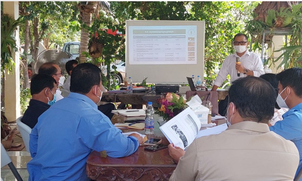
រូបភាពទី១០៖ បទបង្ហាញផ្សព្វផ្សាយគម្រោងដល់ប្រតិបត្តិករផ្គត់ផ្គង់ទឹកស្អាត នៅស្ថានីយទឹកស្អាតបែកបាន

នៅត្រីមាសទី១ សមាគមបានរៀបចំកិច្ចប្រជុំឆ្លុះបញ្ចាំងការអនុវត្តគម្រោង «ការពង្រឹងគណនេយ្យភាពរបស់សេវាកម្មផ្គត់ផ្គង់ទឹកស្អាត ដើម្បីលើកកម្ពស់សេវាកម្មទឹកស្អាត» ចំនួន ២ដង ក្រោមជំនួយឧបត្ថម្ភអង្គការវ៉តធើអេតកម្ពុជា (WaterAid) នៅក្រុមហ៊ុនលង្វែក ឌីវឡូបមិន វ៉តធើសីបង្ហាយ ឯ.ក. និងស្ថានីយផ្គត់ផ្គង់ទឹកស្អាតបែកបាន។ សមាសភាពអ្នកចូលរួមអញ្ជើញមកពី តំណាងមន្ទីរឧបស តំណាងរដ្ឋបាលស្រុក មេឃុំ ប្រតិបត្តិករផ្គត់ផ្គង់ទឹកស្អាត បុគ្គលិកអង្គការវ៉តធើអេតកម្ពុជា និងបុគ្គលិកសមាគម។