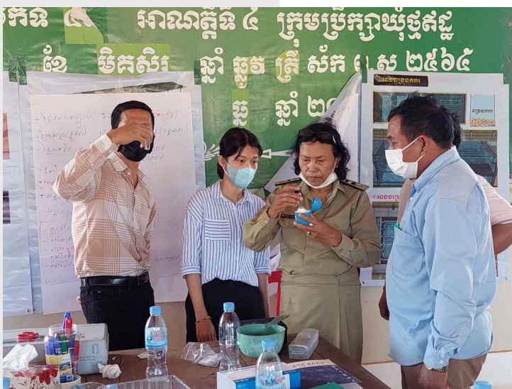
រូបភាពទី១២៖ វគ្គបង្វឹកស្តីពី «ការតេស្តគុណភាពទឹកស្អាត»

នៅត្រីមាសនេះ សមាគមក៏បានសហការជាមួយរដ្ឋបាលស្រុកកំពង់ត្រឡាច ដើម្បីរៀបចំវគ្គបង្វឹកស្តីពី «ការតេស្តគុណភាពទឹកស្អាត» នៅឃុំទាំង ១០របស់ស្រុកកំពង់ត្រឡាច ក្រោមការឧបត្ថម្ភពីអង្គការវ៉ែតធីអេតកម្ពុជា។ អ្នកចូលរួមសរុបចំនួន ៨៥នាក់ (ស្រី ២២នាក់) ដែលមានសមាសភាពចូលរួមពីតំណាងមន្ទីរឧបនគរ ខេត្តកំពង់ឆ្នាំង មន្ទីររដ្ឋបាលស្រុកកំពង់ត្រឡាច មេឃុំ និងសមាជិកក្រុមប្រឹក្សាឃុំ ប្រតិបត្តិកម្មផ្គត់ផ្គង់ទឹកស្អាត។