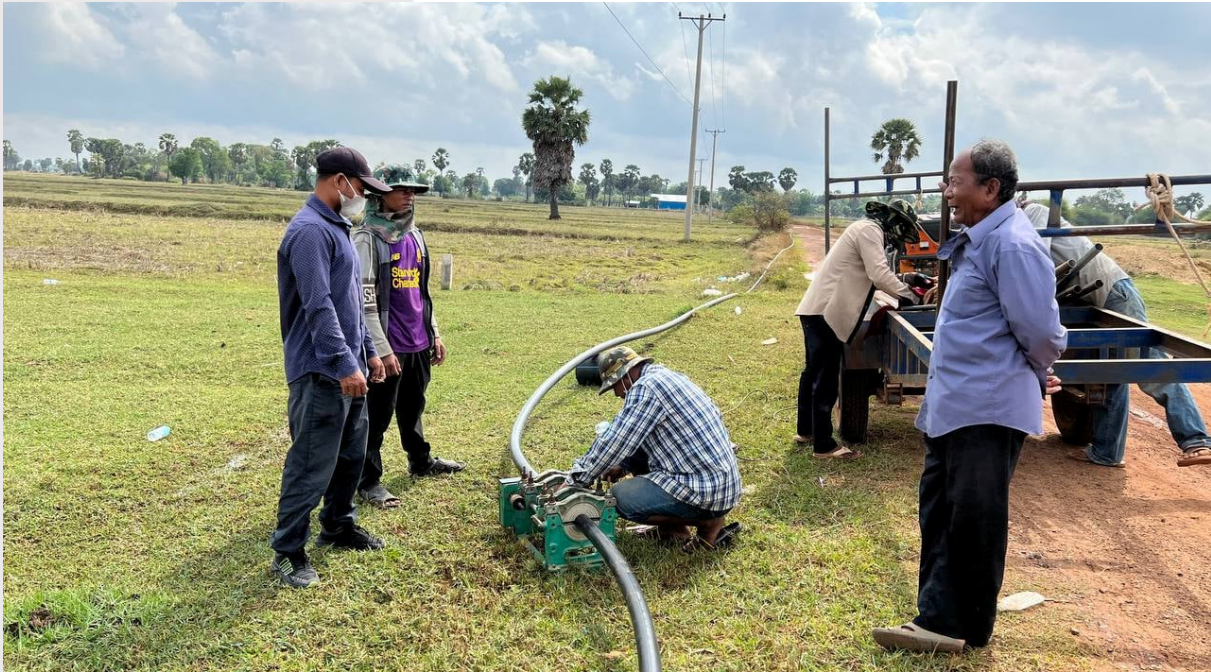
រូបភាពទី៩៖ សកម្មភាពតុល្យទឹកស្អាត របស់ស្ថានីយទឹកស្អាតវាលពង័

ថ្ងៃទី២២ ខែមីនា ឆ្នាំ២០២២ បុគ្គលិកបច្ចេកទេសសមាគម បានចុះត្រួតពិនិត្យ និងផ្ទៀងផ្ទាត់បំពង់បណ្តាញ ចែកចាយទឹកស្អាត នៅស្ថានីយផ្គត់ផ្គង់ទឹកស្អាត វាលពង័ ដែលមានទីតាំងនៅឃុំវាលពង័ ស្រុកឧដុង្គ ខេត្តកំពង់ស្ពឺ។