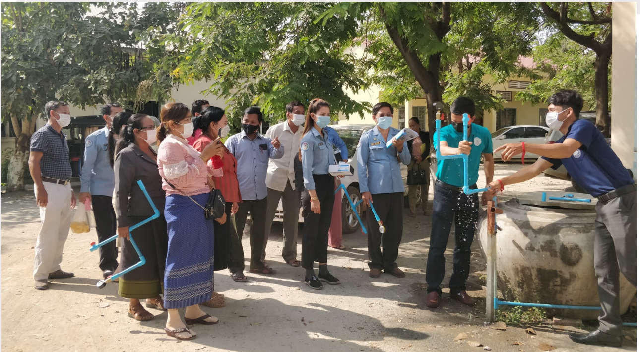
រូបភាពទី១១៖ ការធ្វើតេស្តសម្ពាធទឹកនៅសាលាស្រុកសំរោងទង ខេត្តកំពង់ស្ពឺ