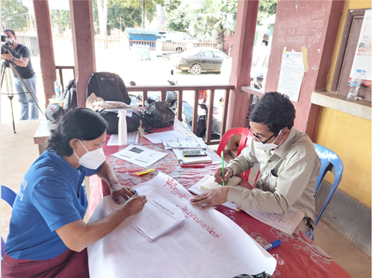
រូបភាពទី១៣៖ ការរៀបចំផែនការរបស់ឃុំ

ត្រីមាសទី១ ឆ្នាំ២០២២ គម្រោងបានធ្វើបច្ចុប្បន្នភាពផែនការគ្រប់គ្រងធនធានទឹកប្រកបដោយបរិយាប័ន្នសម្រាប់ស្រុកសាមគ្គីមានជ័យ ដោយផ្អែកលើស្ថានភាពជាក់ស្តែងបច្ចុប្បន្ន និងជំរុញឱ្យមានការអនុវត្តសកម្មភាពរួមគ្នា និងការចូលរួមរបស់អ្នកពាក់ព័ន្ធសំខាន់ៗ ជាពិសេសការចូលរួមដ៏មានអត្ថន័យរបស់តំណាងក្រុមជនងាយរងគ្រោះ និងស្ត្រី ក្នុងការគ្រប់គ្រងធនធានទឹក និងវិស័យទឹកស្អាត និងអនាម័យ។